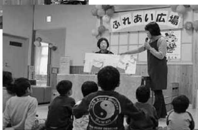
▲下市おはなし会のお話

下市町交流センター「ごんたくんの家」で交流センター事業「ふれあい広場」が開かれました。これは町民の皆さんに参加、また協力してもらうことでイベントをより身近に感じ大勢の方に来館してもらうことを目的に行われています。あきつボランティアグループによるあつあつで具だくさんの豚汁と、「NPO法人どろん