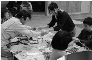
▲「ブンブンこま」作り