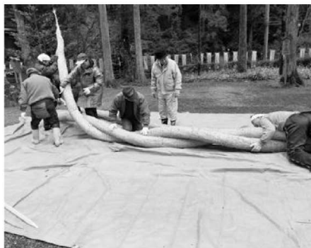
丹生川上神社下社での 大注連縄作りの作業

た部分、とがった部分、ちよつと足りない部分、だからあかんなん、でなく、でもええわ、と感じられたら、お互いの相性は合う、のではないのでしょうか。