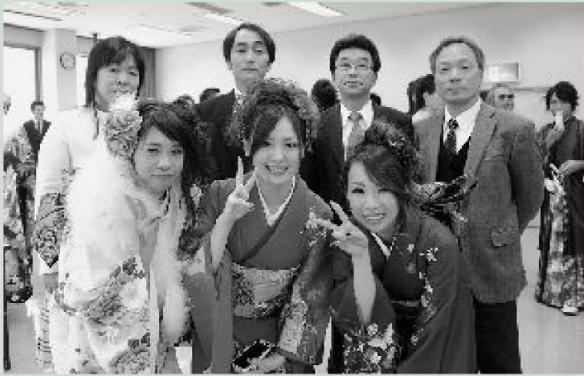
▲下市中学校の恩師と一緒に記念撮影