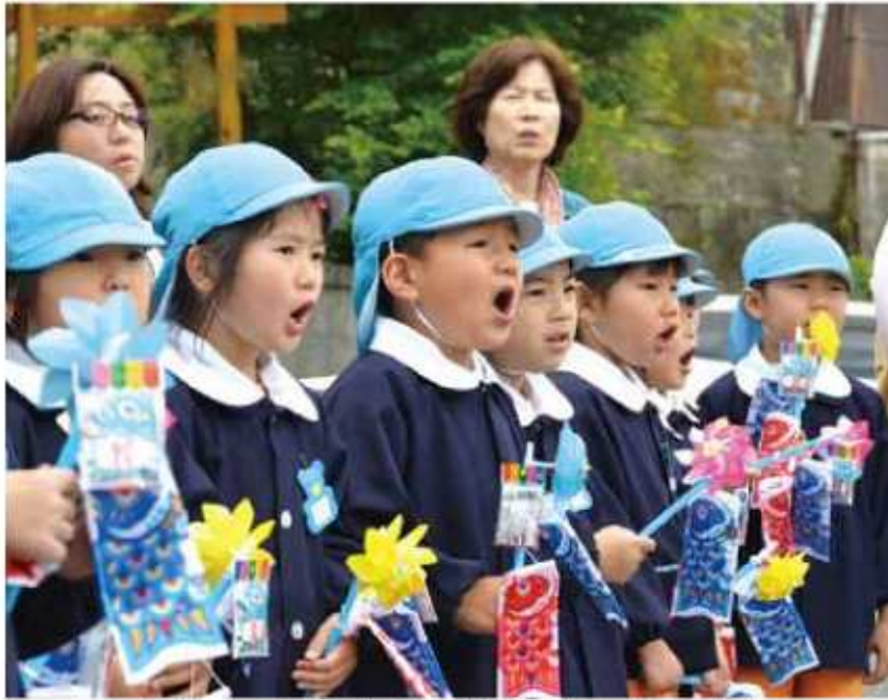
▲大きな声で童謡「こいのぼり」を歌う園児たち

7月に誕生日を迎える3歳までのお子さんの写真を募集しています。掲載される写真のデジタルデータまたはプリントした写真をお持ちください。 【締め切り】 6月6日（金） 総務課