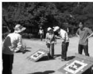
▼丹生地区ふれあい大会

広橋ふるさと、絆運動会が旧広橋小学校運動場で、また丹生地区ふれあい大会が西山にある旧丹生小学校運動場で開催されました。この日は子どもからお年寄りまで幅広い世代が汗を流し、親睦を深めていました。