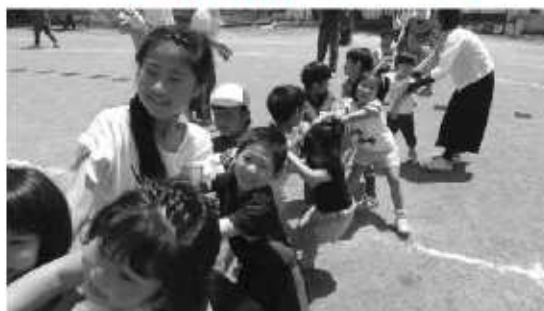
▲広橋ふるさと“絆”運動会

広橋ふるさと、絆運動会が旧広橋小学校運動場で、また丹生地区ふれあい大会が西山にある旧丹生小学校運動場で開催されました。この日は子どもからお年寄りまで幅広い世代が汗を流し、親睦を深めていました。