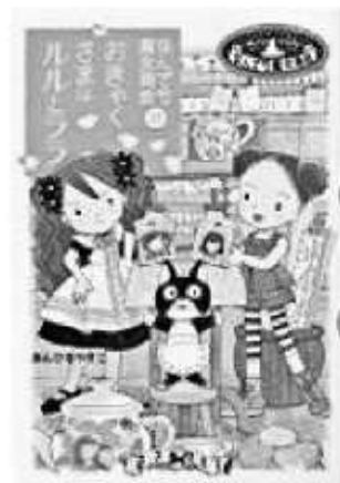
あんびるやすこ / 著 岩崎書店

ある日、なんでも魔女商会リファーム支店にお菓子屋さんのルルとララがおきやくさまとしてやってきました。