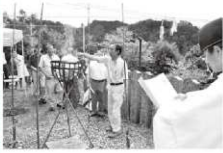
製品に至らなかった箸をご神火にくべて感謝する関係者

下市特産の割り箸と木に感謝する「箸祭り」が、下市八幡神社の境内にある杉箸神社で営まれました。小雨の降る中行われた祭典には、吉野杉箸商工業協同組合や下市製箸協同組合など関係者20人が出席しました。参列者は、製品に至らなかった箸をご神火に投げ入れ供養し、箸への感謝と割箸業界の発展を願いました。