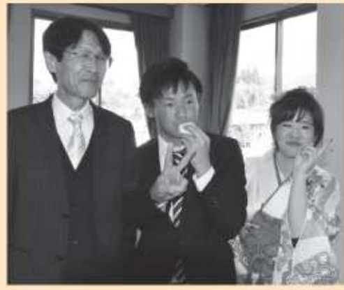
恩師と一緒に記念撮影

ご成人おめでとうございます。皆さんの力で、落ち着いた雰囲気厳肅な式典を作り上げてくれました。皆さんとともに感激の時間を過ごせたことに、感謝申し上げます。 卒業して五年ぶりに君たちにお出会いすることができました。懇親会では、互派に成長した新成人の皆さんに囲まれて、近況を聞かせていただき、五年前の教室に戻った気持ちでした。既に社会人として活躍している人は、さすがに丁寧な言葉遣いと礼儀作法で挨拶にきてくれました。また、学びの道半ばの人は、輝いた眼で夢を語ってくれました。それぞれの人々が、足跡をしっかりと残しながら自分の腕を磨き、人間としての成長を続けてくれることを期待します。