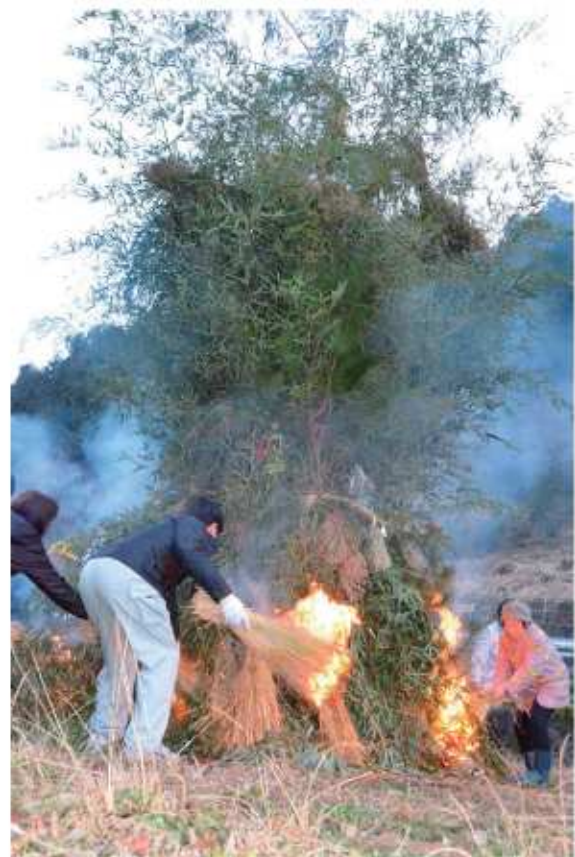
▲地域の伝統行事「どんど」の様子(草谷)