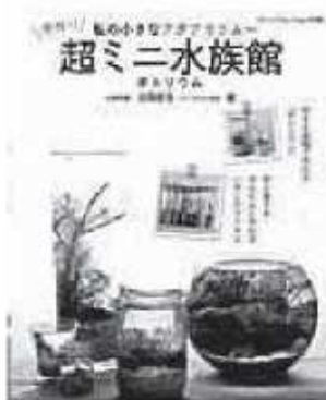
田畑哲生 / 著 ブティック社

水槽やエアポンプなどを使わずに、ボトルや水草を使ってつくるアクアリウム、「ボトルリウム」。基本のつくり方から様々な容器を使ったものまで、写真でわかりやすく解説しています。