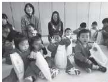
▲下市ユートピア保育園