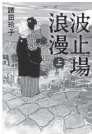
諸田玲子 / 著 日本経済新聞出版社

稀代の俠客として名を馳せた次郎長は維新以降、旧幕臣と官軍が入り乱れる殺伐とした清水で地元の名士となり、波止場をつくる時も先頭にたった。その義女となった「けん」を主人公にした、町の物語、恋の物語です。