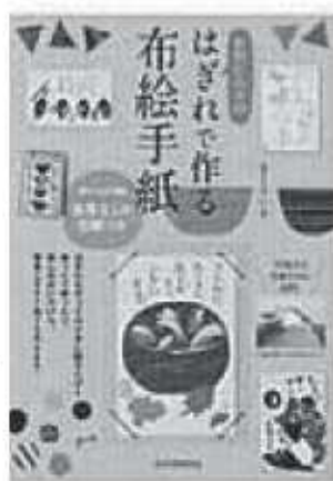
きくちいま / 著 河出書房新社

はぎれのパーツを両面テープではがきに貼って作る布絵手紙。道具は両面テープとはさみだけです。ベースの型紙をアレンジしたり、貼り方や布をかえて、いろんな布絵手紙が作れます。