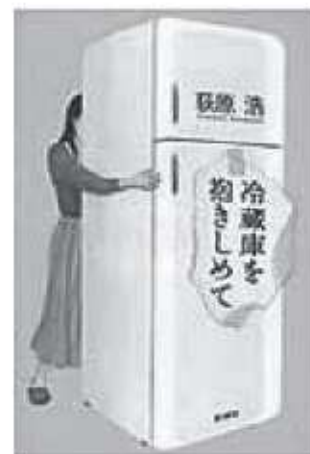
荻原浩 / 著 新潮社

新婚旅行から戻って、はじめて夫との食の嗜好の違いに気づき、それでもなんとか自分の料理を食べさせようと苦悶するなかで、摂食障害の症状が出てきてしまう女性を描いた表題作他、現代人のライトだけど軽くはない心の病気に皮肉に真剣に迫る短編集です。