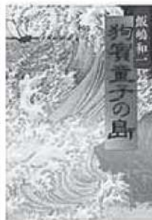
飯嶋和一 / 著 小学館

弘化 3 年(1846)日本海に浮かぶ隠岐「島後」に、はるばる大阪から流された、人の少年がいた。西村常太郎、十五歳。大塩平八郎の学兵に連座した父の罪による処罰だった。しかし島の人々には温かく迎えられ、技術を学び、やがて島に医師として深く根を下ろすが、徐々に島の外から重く暗い雲が忍び寄っていた。