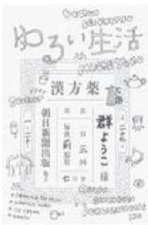
群ようこ / 著 朝日新聞出版

ある日突然めまいに襲われ、飛び込んだ「漢方薬局」。 そこで教えられたのは、冷え、水分、甘み、余分なものを体から抜きとっていく暮らしだった。体質改善を綴った記録エッセイです。