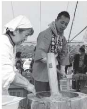
▲とってもおいしい杵つき餅