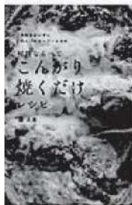
堤人美 / 著 主婦の友社

野菜や肉、魚を切って並べて、あとはオーブンもしくはトースターへ入れて焼くだけ。1・2種類の材料でできるシンプル料理から、おもてなしにぴったりのごちそう料理やスイーツまで幅広いレシピが載っています。