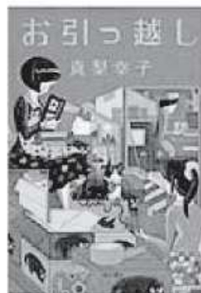
真梨幸子 / 著 KADOKAWA

マンションの見学に来たキヨコ。避難経路が気になり非常口の扉を開けると、そのまま閉じ込められてしまう。無事に出ることはできるのか。「引越し」にまつわる恐怖を描く連作短編集です。