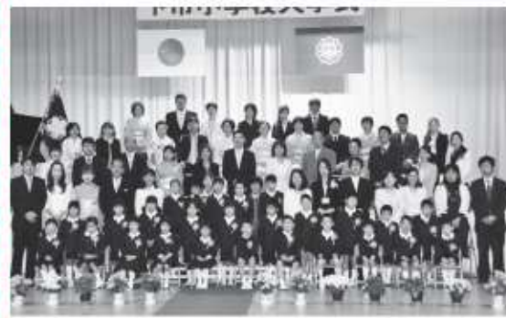
▲下市小学校入学式