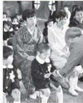
▲下市幼稚園入園式

4月7日から9日にかけて、町内の幼稚園・小学校・中学校で入園・入学式が行われました。今年入学（園）したのは、幼稚園13人、小学校26人、中学校33人です。新1年生たちは、お兄さん、お