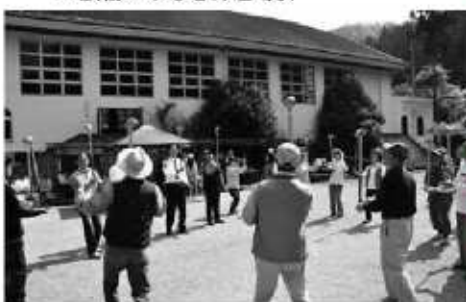
▲丹生地区ふれあい大会