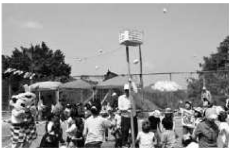
▲広橋ふるさと絆運動会