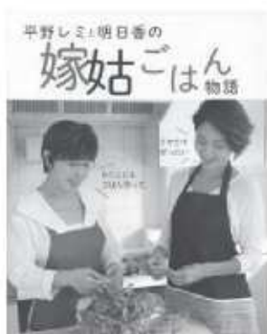
平野レミ / 著 和田明日香 / 著 セブン&アイ出版

料理愛好家の平野レミと嫁・明日香によるお腹がよじれるほどにおもしろい、半分よみもの、半分レシピの本です。口の中が帳尻の合うメニューなど、著者ならではのレシピ満載です。