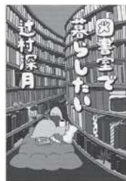
辻村深月 / 著 講談社

著者が作家になる前から、作家になってから、夢中で追いかけてきた小説、漫画、アニメ、音楽、美味いものなどについてつづったエッセイ集です。短篇「おじいちゃんとおひさまのかおり」も収録しています。