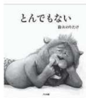
鈴木のりたけ / 作・絵 アリス館