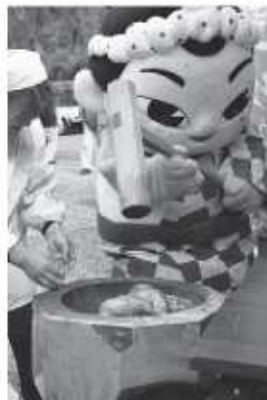
▲とってもおいしい杵つき餅