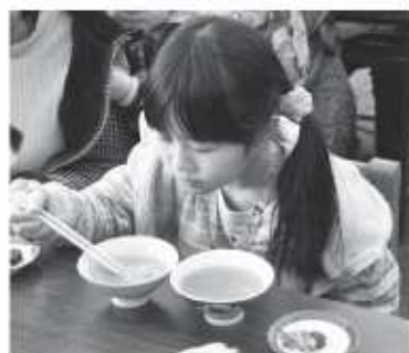
▲振る舞われた茶粥