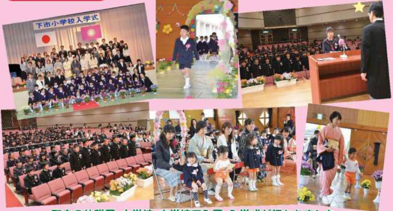
町内の幼稚園・小学校・中学校で入園、入学式が行われました。