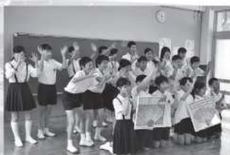
▲下小6年生によるビデオメッセージ撮影の様子

2ヶ月たった今でも悲惨な状況である現地を目の当たりにした職員は、今後もしばらくの間に引き続きの支援の必要性和行政間の協力体制構築の重要性を痛感したようです。住民の皆さんには「いつ起きるかわからない災害に向けて、日頃から備蓄品を備えることや、地域の絆を深めることなど何ができるかを考えてほしい」と話していました。