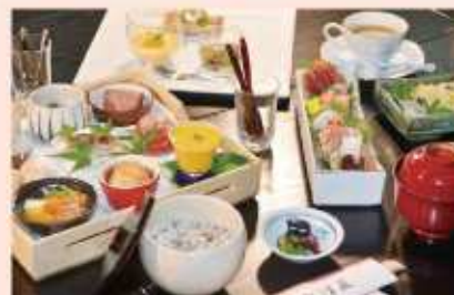
レディース会席(3,000円)