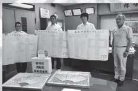
▲下市中学校生徒の応援メッセージ