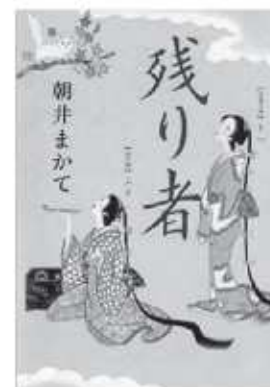
朝井まかて / 著 双葉社

徳川家に江戸城の受け渡しを命じられる。官軍の襲来を恐れ、女中たちが我先にと脱出を試みるなか、大奥にとどまった「残り者」がいた。彼女たち5人が起こした思いがけない行動とは…。