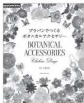
寺西恵里子 / 著 朝日新聞出版

手軽に手早く仕上がるプラバンを素材にした、ボタニカル(植物)のアクセサリーのつくり方を紹介しています。色鉛筆での着色なのでふんわり優しい色合いに仕上がります。