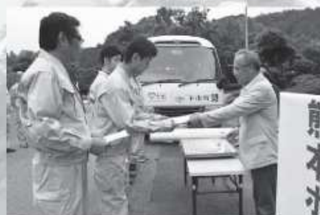
▲ボランティア職員出発式