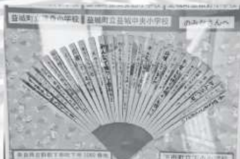
▲下小6年生の割り箸を使ったメッセージ