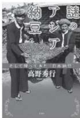
高野秀行 / 著 新潮社

誰もが「日本独自の伝統食品」と信じて疑わない納豆。だが、アジア大陸には日本人以上に納豆を食べている民族がいくつも存在した。日本の納豆とアジアの納豆は同じなのか、違うのか？起源はどこなのか？そもそも納豆とは一体なんなのか？