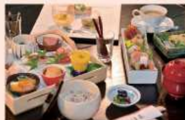
レディース会席 (3,000円)