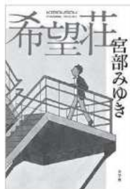
宮部みゆき / 著 小学館

家族と仕事を失った杉村三郎は、東京都北区に私立探偵事務所を開業した。ある日、亡き父が残した「人を殺した」という告白を調査してほしいとの依頼があり……。