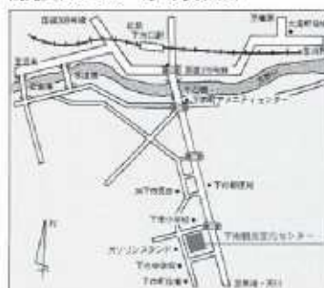
観光文化センター付近見取り図