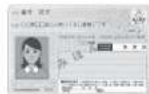
マイナンバーカード見本