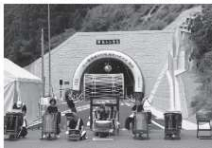
くれない組による力強い和太鼓演奏

長谷と丹生の間で進められていた、トンネルを主体とした国道309号の丹生バイパスが開通しました。式典を前に下市町のアンサンブルP.B.S.が美しい歌声で、また黒滝村のくれない組が力強い太鼓の演奏で開通を祝いました。