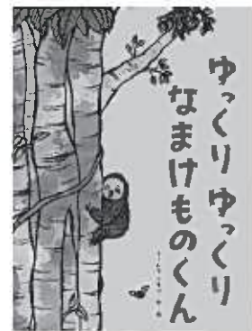
オームラトモコ / 作・絵 鈴木出版

たかいきのうえにすむなまけものくんがみずあびをしようとしてゆっくりおりにいきます。とちゅうでいろんなどうぶつにであうのですが!