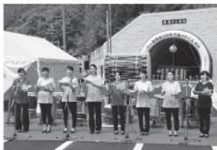
アンサンブルP.B.S.の美しい歌声