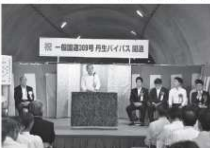
トンネルの中で行われた式典