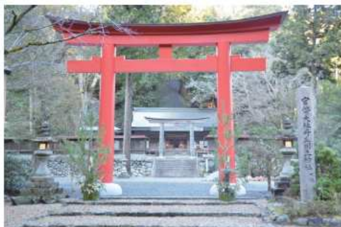
新しい鳥居で迎春 ～丹生川上神社下社～

人 口 5,802人 (-25) 男 2,722人 (-11) 女 3,080人 (-14) 世帯数 2,519世帯 (-8) ( )内は前月比 出生 2人 死亡 13人 転入 3人 転出 17人