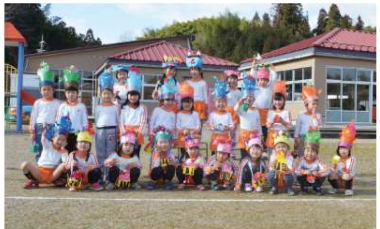
鬼のお面をつけてハイポーズ! (下市幼稚園の節分行事)