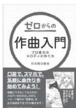
市月朔日義昭 / 著 ヤマハミュージックメディア

口笛で、スマホで、気軽に作曲りを始めてみよう！音楽の知識がなくても作曲できるように、メロディ作りからイメージ通りの「雰囲気」を出す技術まで、プロがやさしく教えます。