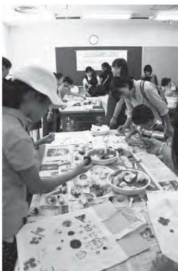
▲オリジナル図書館バッグ

他にも、童話に関連する問題を 解きながら進む「クイズde迷路」 が設けられ、子どもたちの人気を 集めていました。迷路は「なかよ しランドによきによき」などのポ ランティアスタッフがこの日の為