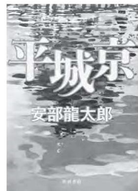
安部龍太郎 / 著 KADOKAWA

遷都を巡る権力争い、反対派の妨害工作、阿倍一族の復活……。タイムリミットはわずか3年。28歳の青年は唐の長安に並ぶ新都を奈良に建造できるのか。古代史最強の謎に挑むミステリーです。