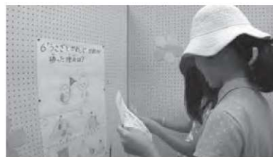
▲クイズ de 迷路

に手作りしたもので、クイズに 全問正解し迷路をクリアした人 は、特製の読書通帳がプレゼント されました。