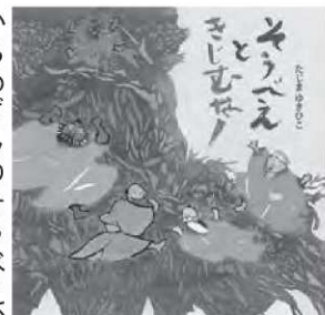
たじまゆきひこ / 作 童心社

★○印が休館日です ★開館時間 木曜日〜月曜日 午前9時〜午後5時 ★開館時間以外は、玄関脇の返却BOXへお返しください。 (DVD・ビデオテープを除く)