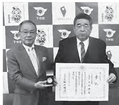
▲伝達式の様子 (3/22、役場町長室)