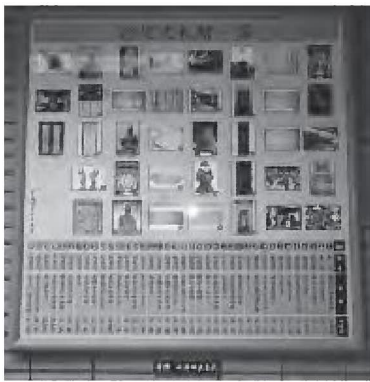
▲寄贈いただいたパネル