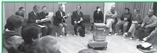
平成29年度タウンミーティングの様子