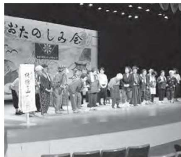
▲会員による芝居の様子