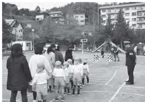
▲親子で横断歩道をわたる様子

運動場には白線で道路や横断歩道が描かれ、踏切や歩行者番号も設置され、警察官から習ったことを親子で実践しました。