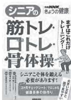
荒井秀典ほか / 監修 NHK出版

シニアこそ、体を鍛えよう！基本の「筋トレ」から、好物を食べ続けるための「ロトレ」骨を強くする「骨体操」まで、無理なく取り組めるトレーニングを紹介しています。