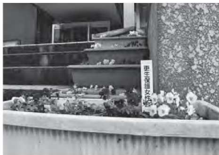
▲役場玄関前の階段にも設置されています。

社会を明るくする運動は、犯罪のない明るい地域を築くための運動で、7月の強調月間を中心に、更生保護女性会や保護司会が地域住民と協力して取り組んでいます。