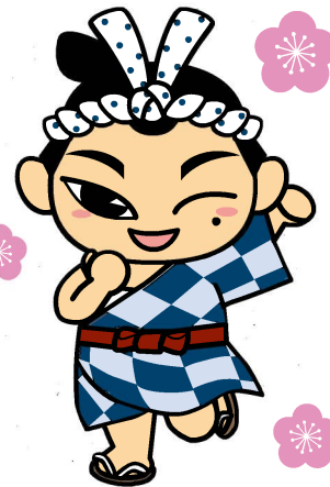
下市町マスコットキャラクター ごんたくん