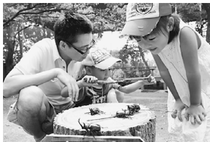
奈良市から来られた家族