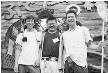
スタッフです！ みんな遊びにきてや〜