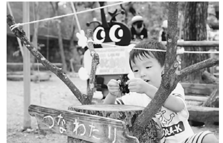
大和高田市から来られた家族