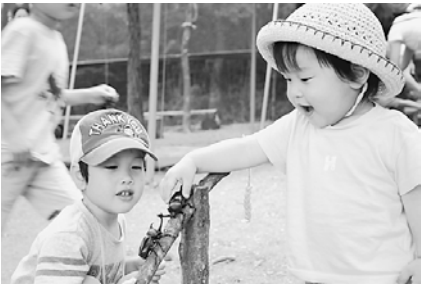
西ノ宮市から来られた家族