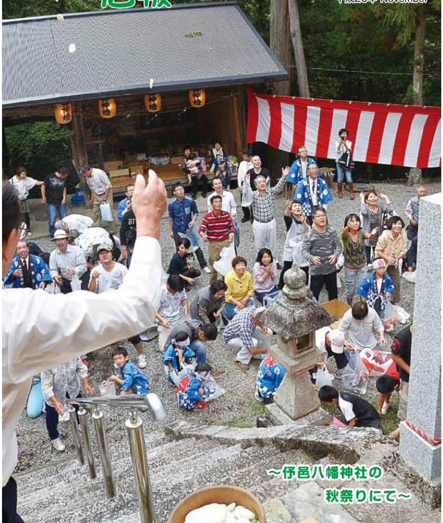
～仔呂八幡神社の 秋祭りにて～