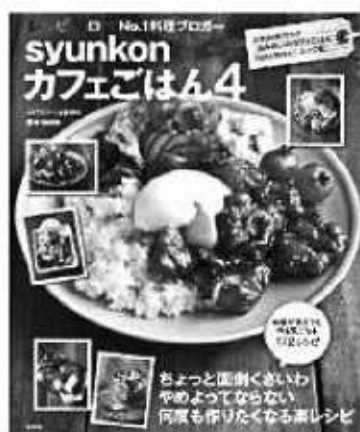
山本ゆり / 著 宝島社

人気のブログを手軽に書籍化した、身近な材料で簡単！ おいしい！そして面白い！レシピ本です。シリーズ ズで所蔵しています。