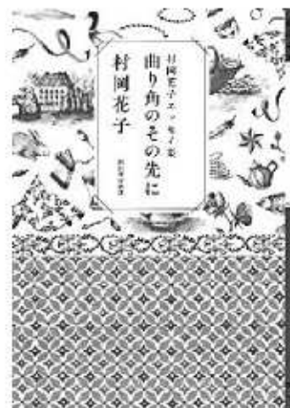
村岡花子 / 著 河出書房新社