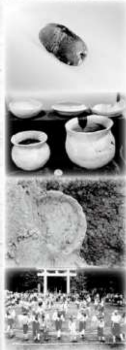
写真上から 大淀町指定史跡・奥山古墳出土の埴輪土 土器類、奥山でみつかった古墳時代の土器 下市町・丹生川原古墳内発掘出土の土師器 奈良県指定史跡文化財、丹生の大塚古墳