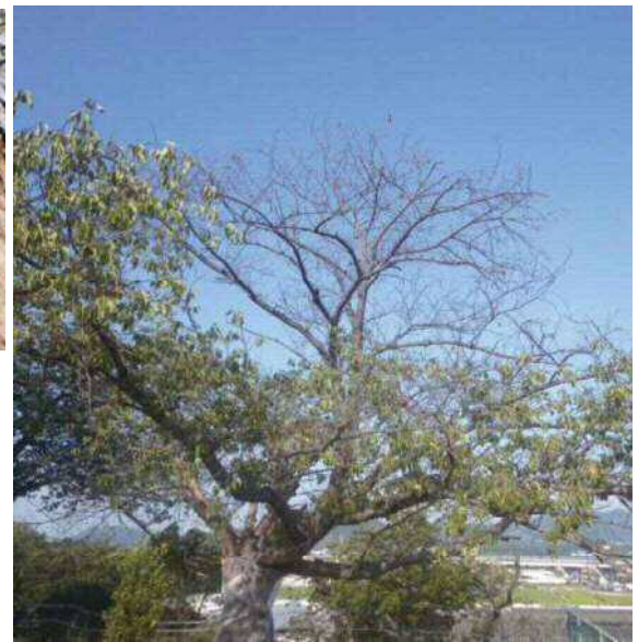
枝の一部が枯れたサクラ 被害初期は一部の枝が枯れることが多い