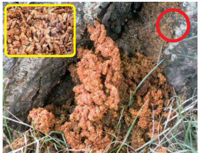
クビアカツヤカミキリの幼虫が出すフラス 枠内・指ですりつぶしてルーペで見ると、繊維質が無い