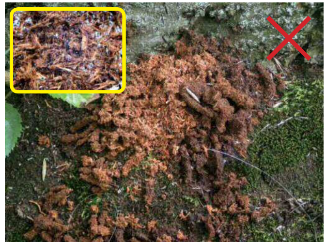
良く似たフラス（他のカミキリ） 枠内・指ですりつぶしてルーペで見ると、繊維質が多い