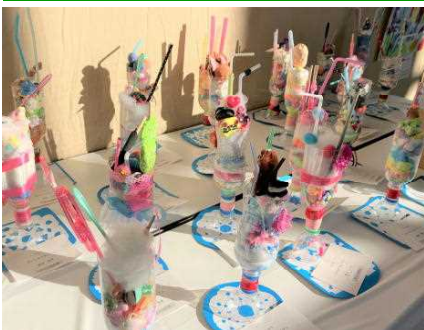
<小1・おいしそうなパフェ>