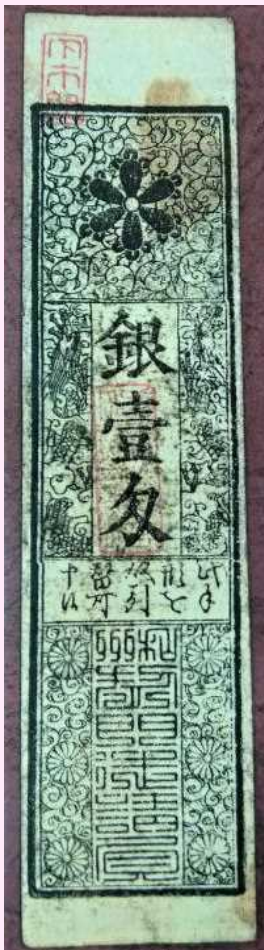
< 菊田氏寄贈・下市札 >

この発想は、SDGsにも通じる視点です。人々のためになるように工夫をして商売をした先人の知恵を、下市プライドとして、次世代へ受け継ぎたいものです。