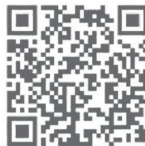
デザイン募集ページのQRコード