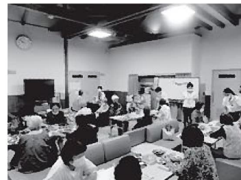
たんぼぼカフェの様子

令和7年には5人に1人は認知症になると言われています。そこで、認知症の人や家族介護に携わる方などが、気軽に話せて和やかに集える場所が認知症カフェです。お気軽にご参加ください。