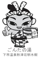
ごんたの湯 下市温泉秋津荘明水館