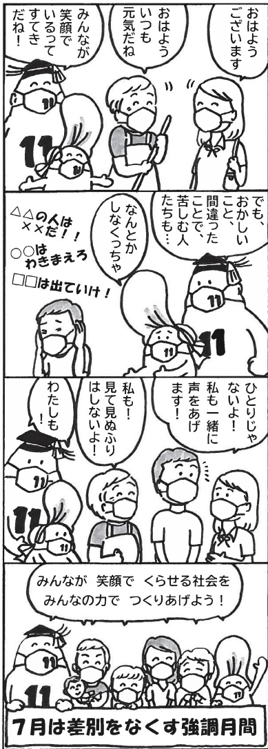
7月は差別をなくす強調月間