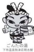
ごんたの湯 下市温泉秋津荘明水館