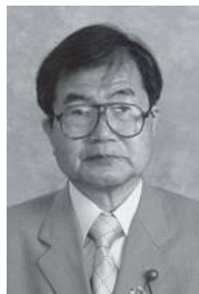
矢野 和男 議員

議会の議員として通算35年以上在籍し、地方自治の発展に顕著な功労があったと認められ、総務大臣から矢野和男議員へ感謝状が授与されました。矢野議員は昭和62年5月1日に初当選以来、永きにわたり議会議員として多様な町民の意見を反映させ行政サービスの向上に尽力されています。