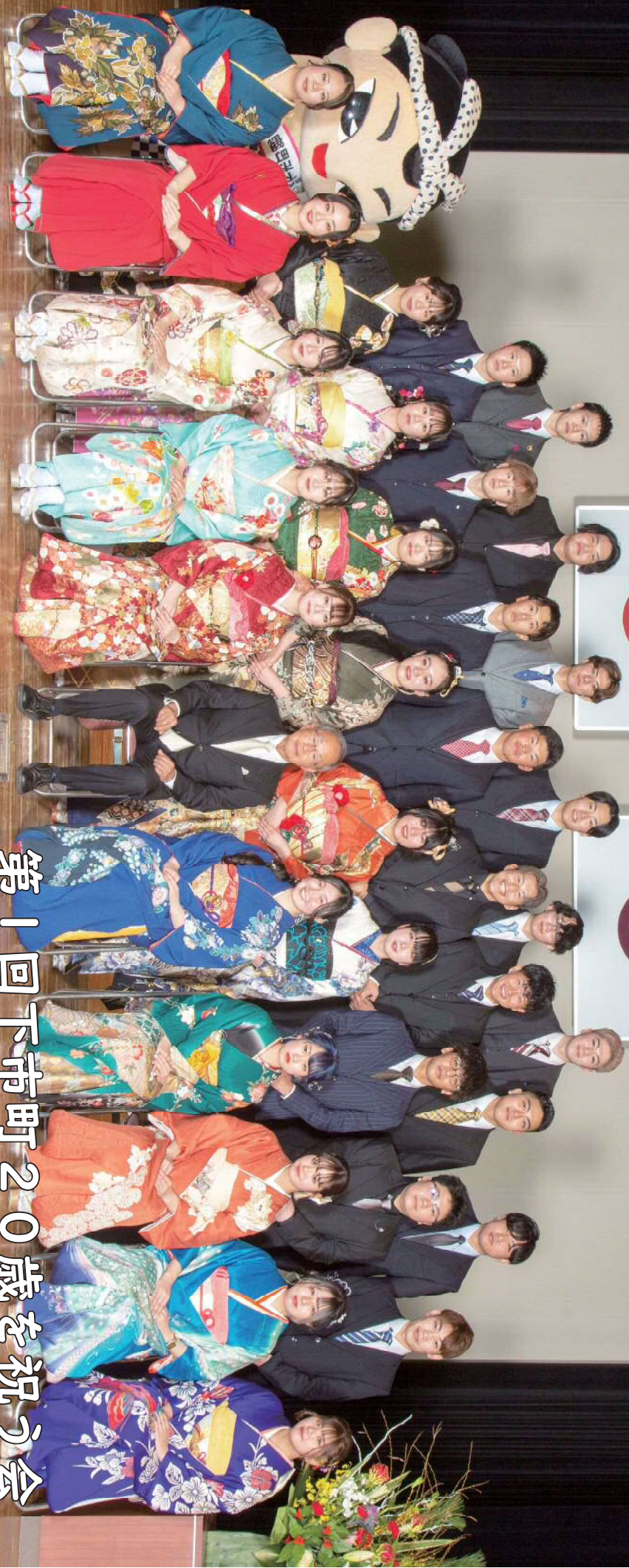
第1回下市町20歳を祝う会