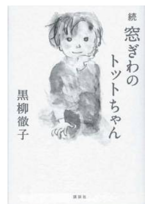
黒柳 徹子 [著] 講談社

東京大空襲の数日後、青森を目指して、ひとり夜行列車に乗ったトットを待ち受けていた試練とは？NHKの専属女優になりたての、トットが救われた一言とは？「窓ぎわのトットちゃん」、42年ぶりの続編。