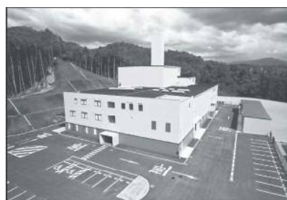
さくら広域環境衛生組合 「さくら美化センター」外観