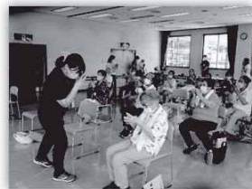
下市町・(株)ミズノスポーツサービス連携協定事業 新たな介護予防教室 ～ラララサーキット・ライト事業 楽しく・ゆかいな教室～

参加者は、介護予防運動指導員と健康運動指導士の指導のもと、DVDを見ながら「ラララサーキットライト」を実施し、体力測定や自宅でできる体操などを学び、「身体がすっきりした」「脳トレが楽しかった」「DVDを見ながら運動できたのが分かりやすかった」と話されていました。