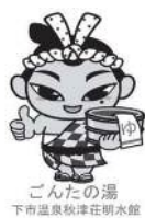
ごんたの湯 下市温泉秋津荘明水館