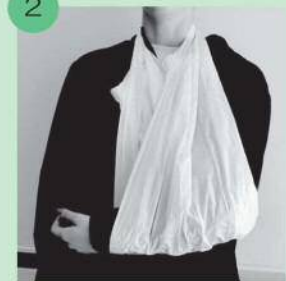
2 袋の持ち手部分を首にかけるだけで三角巾を作ることができます。