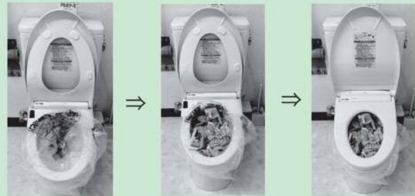
便座を上げ、袋をセットします。新聞紙などを袋に詰め、便座を下ろします。

ポリ袋（45ℓ以上のもの）をトイレの便座にセットし、袋の中に新聞紙やトイレットペーパー、おむつなど吸水性のあるものを敷けば簡易トイレに。排泄後は袋をしっかりと密閉すればにおいや感染症のリスクも防ぐことができます。