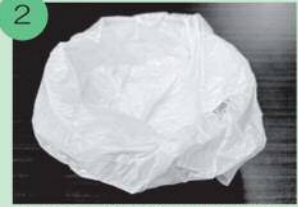
2 上からポリ袋をかぶせたら、使用後はそのまま捨てられます。