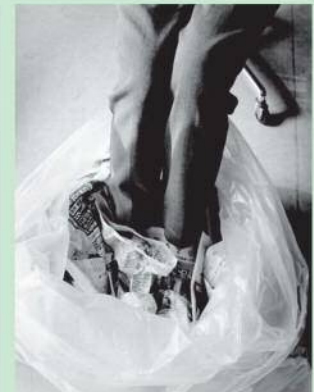
ポリ袋に新聞紙を入れてしっかりと密閉すると暖かく感じます。

ポンチョは本当に暖かく感じました！新聞紙を活用するとより熱がこもり防寒対策になりますね！