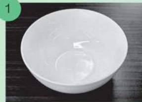
1 家庭にあるお皿を用意します。