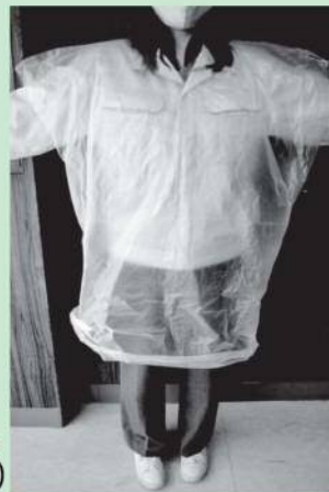
首と肩部分に切り込みを入れるとポンチョに

軽く丸めた新聞紙を袋の中に入れてその中に足を入れると暖かく感じます。新聞紙と一緒に体を覆えばポンチョになります。