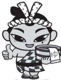
ごんたの湯 下市温泉秋津荘明水館