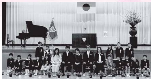
4月7日 下市あきつ学園 入学式