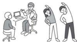
健(検)診、町主催の介護予防事業 など