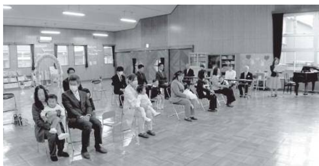
4月10日 下市こども園 入園式