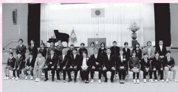
4月6日 下市あきつ学園 進級式